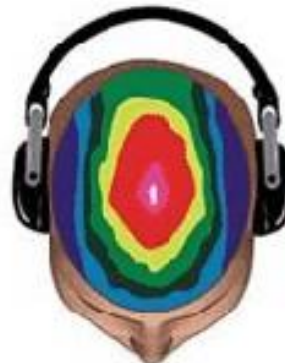
Patrón normal de ondas cerebrales altamente enfocado y su potencial desarrollado

En Sakura, todas las terapias se dan en sesiones de 45 minutos y tienen un mismo precio: