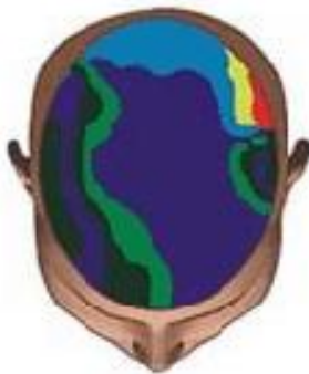
Patrón normal de ondas cerebrales con un enfoque limitado